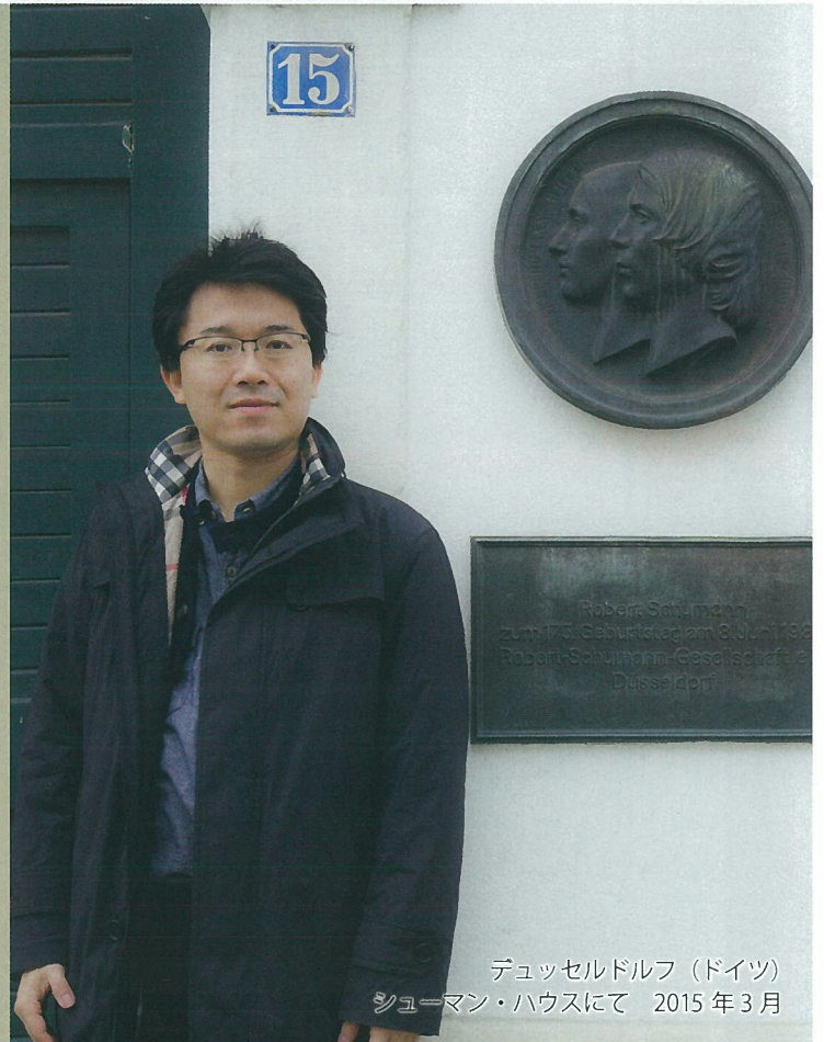
デュッセルドルフ(ドイツ) シューマン・ハウスにて 2015年3月